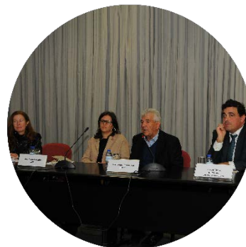
Sessão de abertura dos trabalhos 22/11/2017