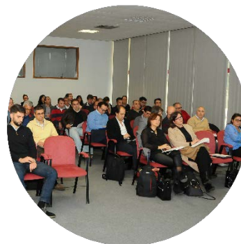
Sessão de abertura dos trabalhos 22/11/2017