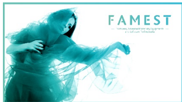
Logotipo e Imagem projeto