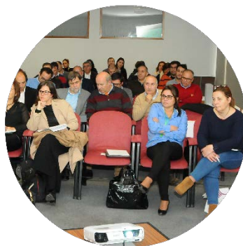
Sessão de abertura dos trabalhos 22/11/2017