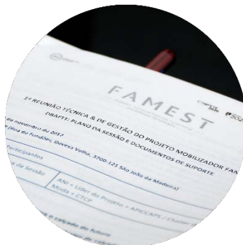
Sessão de abertura dos trabalhos 22/11/2017