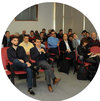
Sessão de abertura dos trabalhos 22/11/2017